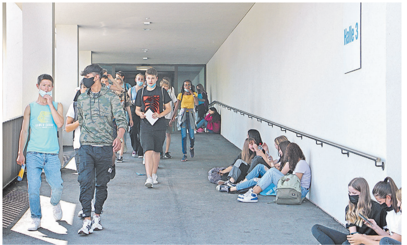
Jugendliche im Berufswahlalter unterwegs im Tägi.

Bereits angelaufen ist in einigen Berufen das Selektionsverfahren für Lernende, um an den SwissSkills 2022 teilzunehmen. Eine Übersicht über die Kriterien und allfällige Voraussetzungen bietet die Website www.swiss-skills.ch/mitmachen . Während in einigen Berufen das Selektionsverfahren bereits gestartet ist, wird in anderen Berufen erst nach den Lehrabschlussprüfungen im Sommer 2022 bestimmt, wer im September an den SwissSkills teilnehmen kann.